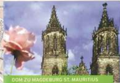
DOM ZU MAGDEBURG ST. MAURITIUS & KATHARINA

46 Hektar Park umgeben das Herrenkrug Parkhotel, welches direkt am Elberadweg und der Elbe liegt. Wir haben Ihnen unsere Empfehlung für eine NATURROUTE und eine STADTERKUNDUNGSROUTE aufgezeichnet.