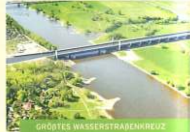
GRÖßTES WASSERSTRABENKREUZ EUROPAS