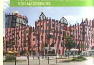
HUNDERTWASSERS GRÜNE ZITADELLE VON MAGDEBURG